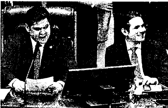
Mesmo pregando harmonia com o Executivo e o Judiciário, Alcolumbre defendeu que o Congresso seja a base de todas as decisões

"O Executivo e o Judiciário não são adversários; são pilares que sustentam a nação. Conclamo a harmonia e ao equilíbrio, pois somente assim resguardaremos os direitos e as