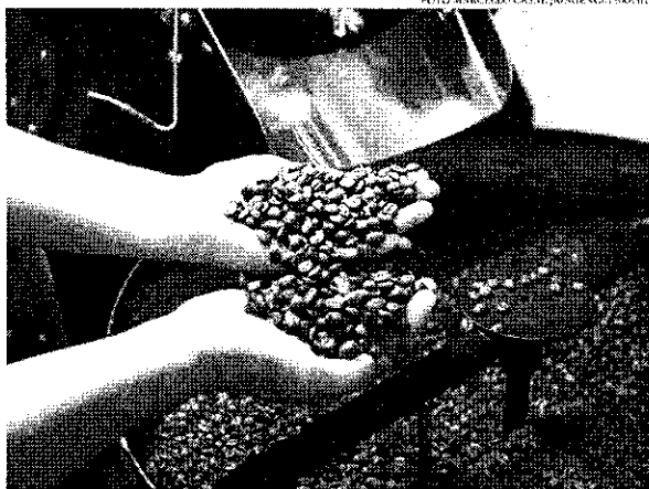
Nas espécies, o café arábica apresentou incremento na produção, alcançando 39,6 milhões de sacas

Nas espécies, o café arábica apresentou leve incremento na produção, alcançando 39,6 milhões de sacas, o que re-