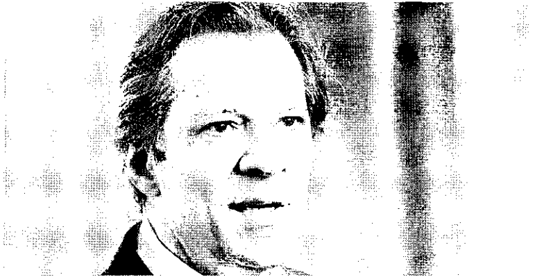
Haddad voltou a defender o compromisso do governo com o arcabouço fiscal e afirmou que uma declaração de Lula em entrevista foi tirada de contexto

Relatório da próxima semana é visto como teste do compromisso da equipe econômica com a meta de contas públicas e equilíbrio fiscal