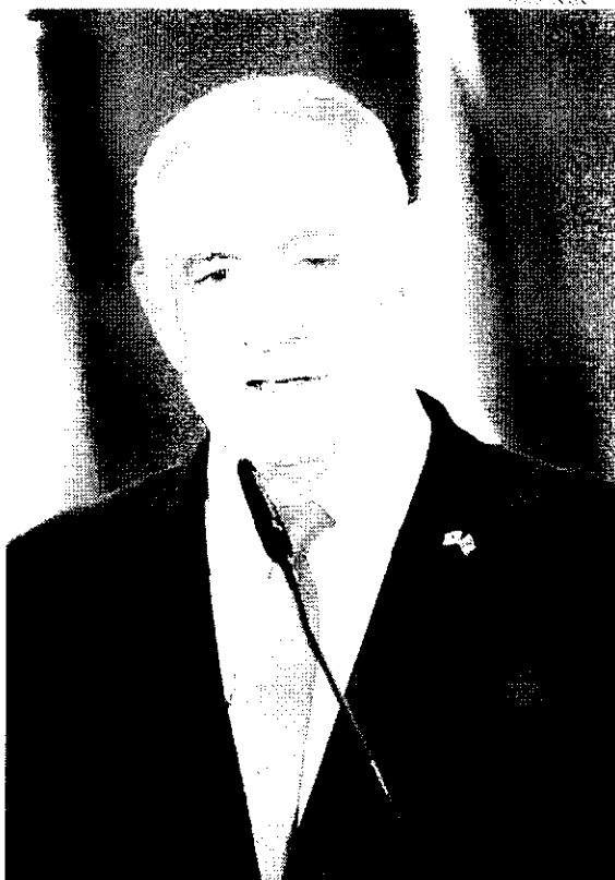
Ordem veio um dia após o ataque de Tel Aviv a uma escola na Cidade de Gaza deixar ao menos 21 mortos

As forças israelenses afirmam que distribuem panfletos com instruções para que os moradores deixem a área e se reúnem em zonas seguras. No domingo também foi postada em rede social e enviada para os telefonistas dos moradores, por