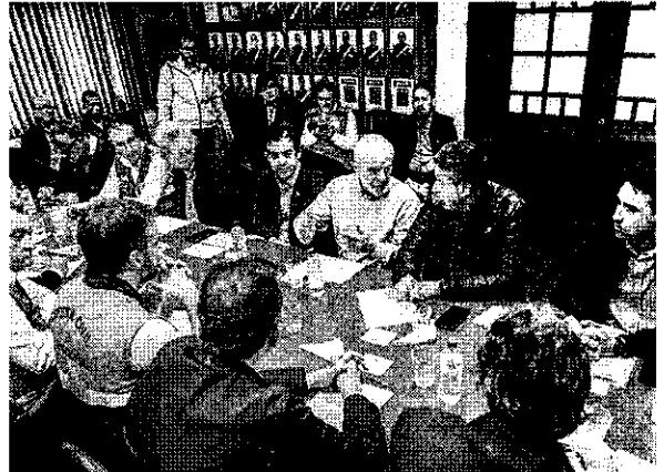
O governador Eduardo Leite pediu que fossem criadas linhas especiais de crédito para 300 municípios

O vice-presidente do Supremo Tribunal Federal (STF), Edson Fachin, por sua vez, disse que a corte vai trabalhar na criação de um regime jurídico "especial e transitório" para o Rio Grande do Sul. "Aqui estamos para manifestar, mais do que eu possa solidariar-me, aqui estamos juntos, o Judiciário está junto com os demais Poderes da República e estará junto espe-