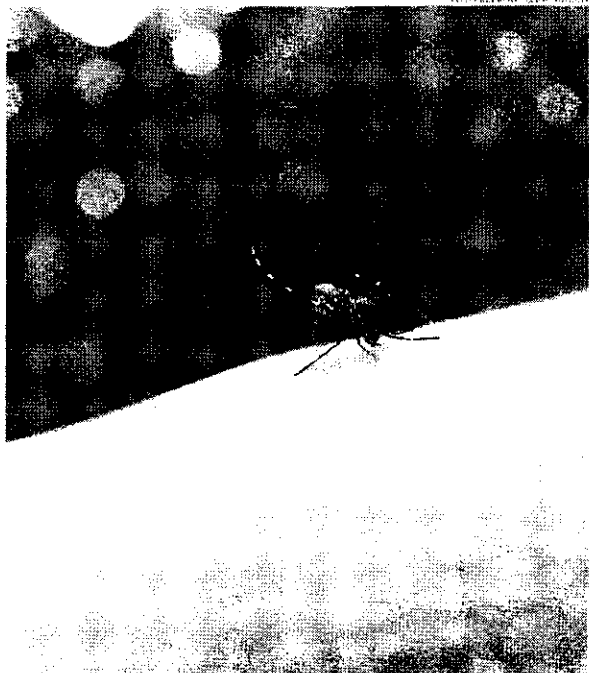
O surto de dengue já deixou hospitais argentinos sobrecarregados e elevou o preço dos repelentes

Neste ano, o surto de dengue argentino já deixou hospitais sobrecarregados e esvaziou prateleiras de