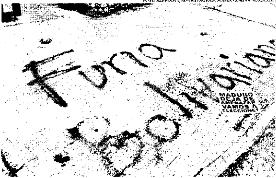
O "Fúria Bolivariana" é um plano cívico, militar e policial para enfrentar tentativas de terrorismo

Conforme o acordo que foi assinado entre o governo e a oposição na Venezuela, com mediação da Noruega, as eleições presidenciais devem aconte-