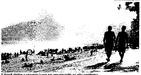
A Brasil detém o segundo lugar em recuperação na pós-pandemia

O volume de recursos investidos por turistas estrangeiros no Brasil foi um recorde: US$ 6,9 bilhões, o equivalente a R$ 34,5 bilhões. Com esse montante, o país assumiu a liderança sul-americana em termos de arrecadação no setor. Os dados são da agência ONU Turismo, contemplam o ranking de 20 países e foram divulgados nessa segunda-feira (05/02). Segundo a estatística, o país detém ainda o segundo lugar em recuperação pós-pandemia nas Américas, registrando aumento de 15% em relação ao período pré-pandemia, ficando atrás apenas do México. Além disso, o Brasil também ocupa a 14ª posição no mundo. De acordo com o levantamento da ONU Turismo, o país com maior crescimento nas receitas deixadas por estrangeiros foi a Suíça, com 79%.