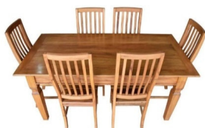
Mesas do restaurante.

No caso de o PERMISSONÁRIO colocar bancos/ banquetas, os mesmos devem seguir o padrão estabelecido na imagem apresentada.